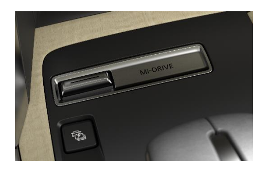
Mi-Drive viene attivato tramite un interruttore situato sulla console centrale, quindi è facile da azionare durante la guida.

I modelli CX-60 PHEV sono in grado di trainare fino a 2.500 kg