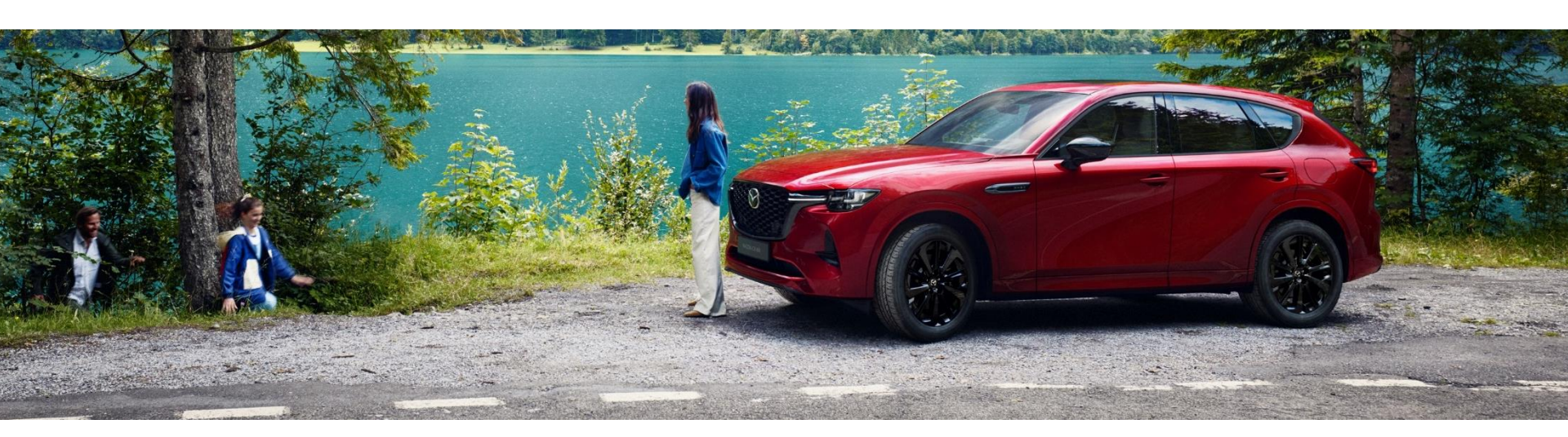
*Dati espressi secondo il nuovo tipo di procedura di omologazione WLTP (Regolamento UE 2017/1151 che integra iL Regolamento CE 715/2007).

I più recenti sviluppi nel design Kodo trasmettono tutta la forza e possenza della Mazda CX-60, con la sua bellezza ed eleganza che si intreccia con la robustezza della sua eccezionale architettura a motore anteriore longitudinale e trazione posteriore, che diventa integrale all'occorrenza. Questa eleganza si concretizza anche nella qualità degli interni, rendendo la CX-60 una scelta di primo livello.