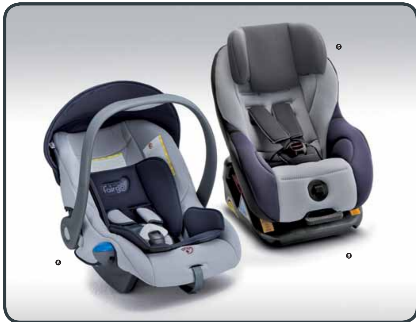
SEGGIOLINO BABY ONE A CHILD SEAT BABY ONE A

Per bambini con peso da 0 a 13 kg. For children weighing from 0 to 13 kg.